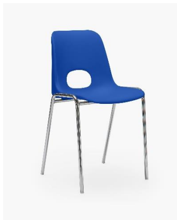
COL. 15 BLU SEGNALE RAL 5005