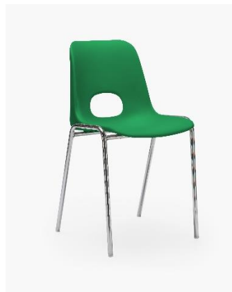
COL. 02 VERDE BRILLANTE PANTONE 3415C (*)