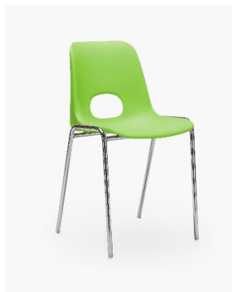
COL. 19 VERDE PASTELLO PANTONE 367C