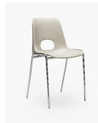
COL. 12 GRIGIO SETA RAL 7044 (*)

(*) il colore è simile al riferimento di collana