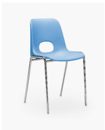
COL. 17 CARTA ZUCCHERO PANTONE 278C