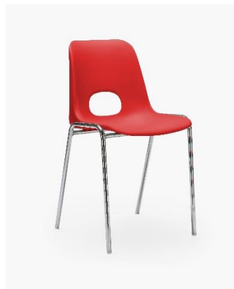
COL. 11 ROSSO TRAFFICO RAL 3020