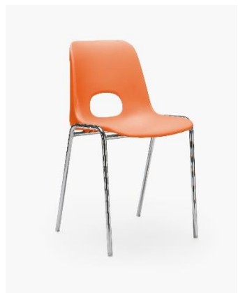
COL. 21 SALMONE PANTONE 163C