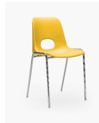
COL. 01 GIALLO TRAFFICO RAL 1023